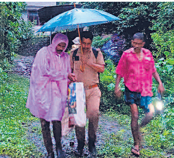
മംഗലം ഓടം തോട് ഉരുൾപൊട്ടലിനെ തുടർന്ന് ഒറ്റപ്പെട്ട കുടുംബങ്ങളെ സുരക്ഷിത സ്ഥലങ്ങളിലേക്കു മാറ്റുന്ന വനപാലകരും പോലീസും.

മംഗലം ഓടം: കടപ്പാറയിൽ മുന്നിടത്ത് ഉരുൾപൊട്ടി. കടപ്പാറ മുൻ ത്തിക്കുന്ന് റോഡിൽ 2007 ൽ ഉരുൾപൊട്ടലുണ്ടായ സ്ഥലത്ത് ഇന്നലെ വീണ്ടും ഉരുൾപൊട്ടലുണ്ടായതായി സമീപവാസികൾ പറഞ്ഞു. 2007 ലെ ഉരുൾപൊട്ടലിൽ ബന്താം ക്ലാസ് വിദ്യാർഥിനി മരിച്ചിരുന്നു. കടപ്പാറ ജംഗ്ഷനടുത്തു മേരിമാത എസ്റ്റേറ്റിനു സമീപമാണ് മറ്റൊരു ഉരുൾപൊട്ടലുണ്ടായത്. ഉരുൾപൊട്ടലിനെ തുടർന്നുള്ള മലവെള്ളപ്പാച്ചിലിനെപ്പോലെയുള്ള പാറക്കല്ലുകളും മരങ്ങളും ഒഴുകി. തളികക്കല്ലി മലയിലും ഉരുൾപൊട്ടലുണ്ടായതായാണ് റിപ്പോർട്ട്. വിത്തൂർ കിഴിയിലും ഉരുൾപൊട്ടിയതായി പറയുന്നു. ഓടം തോട് പടങ്ങിട്ടു തോടിൽ ഉരുൾപൊട്ടി 200 മീറ്ററോളം റോഡ് ഒലിച്ചു പോയി. പ്രളയവർഷങ്ങളിൽ പോലും ഉണ്ടാകാത്ത വിധം ഓടം തോട് ഭാഗത്തു മിന്നൽ പ്രളയമുണ്ടായതായി നാട്ടുകാർ പറഞ്ഞു. മേഘസ്ഫോടനം കണക്കെ മഴ പെയ്തു. മംഗലം ഓടത്തിന്റെ വ്യക്തിപ്രദേശങ്ങളായ കടപ്പാറ, ചുരുപ്പാറ, ഓ