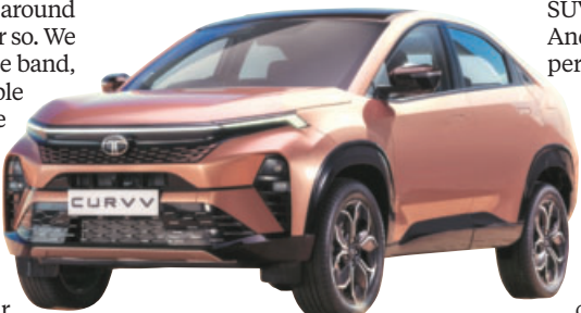
Curvv EV is set for an August 7 launch, with the ICE version to follow within a month

Tata Motors has cars in the sub-compact (Atroz), compact (Punch and Nexon), and also in high-SUV (Harrier and Safari) categories.