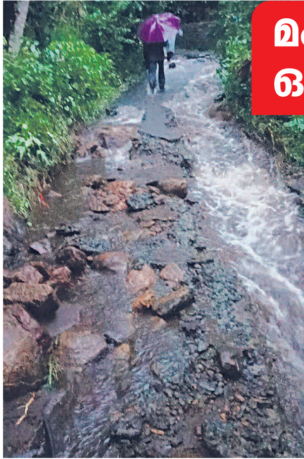
ഉരുൾപൊട്ടലിനെ തുടർന്ന് ഒലിച്ചുപോയ മംഗലം ഓടം തോട് പടങ്ങിട്ടു തോട് റോഡ്.